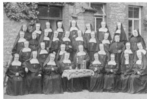
↑ La communauté des religieuses en 1907