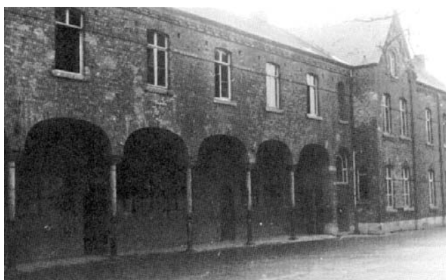
A gauche, les 4 classes primaires inaugurées le 6 octobre 1890. A droite la maison des Frères construite en 1892.

A partir de ce moment, constructions, achats, transformations, créations de sections vont se succéder. Le 6 octobre 1890, on inaugure les 4 classes primaires et, en 1892, ce sera au tour de la maison des Frères.