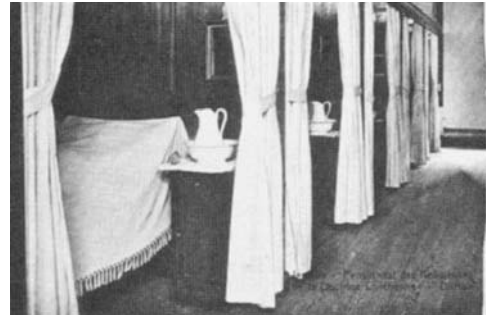
Jemelle. Pensionnat des Sœurs de la Doctrine Chrétienne.