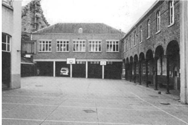
Ouverture de la porte cochère donnant sur la place Roi Albert et aménagement du préau sous la nouvelle salle de gymnastique.

Les bâtiments vont suivre l'augmentation de la population scolaire et les réformes de l'enseignement : ainsi, en 1955, inauguration de la salle de gymnastique, des installations sanitaires et d'un petit préau ; en 1958, construction d'un petit réfectoire dans le jardin derrière la maison des Frères, relié à la cour par un tunnel ; en 1963, aménagement de 4 classes dans la grande salle au-dessus des 4 classes primaires de 1890 et donc la fin des remises des prix, des représentation théâtrales ; en 1967, démolition de la maison des Frères de 1892 et érection du gros bloc moderne.